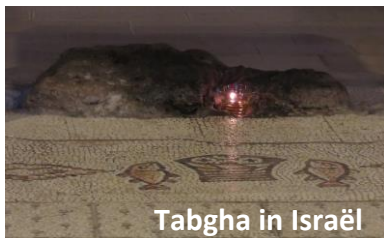
Tabgha in Israël